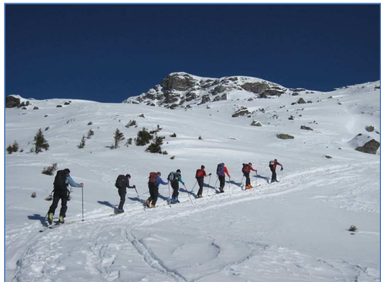
Gruppe Berliat im Vorstieg. Im Hintergrund das Tagesziel, der Fuggstock